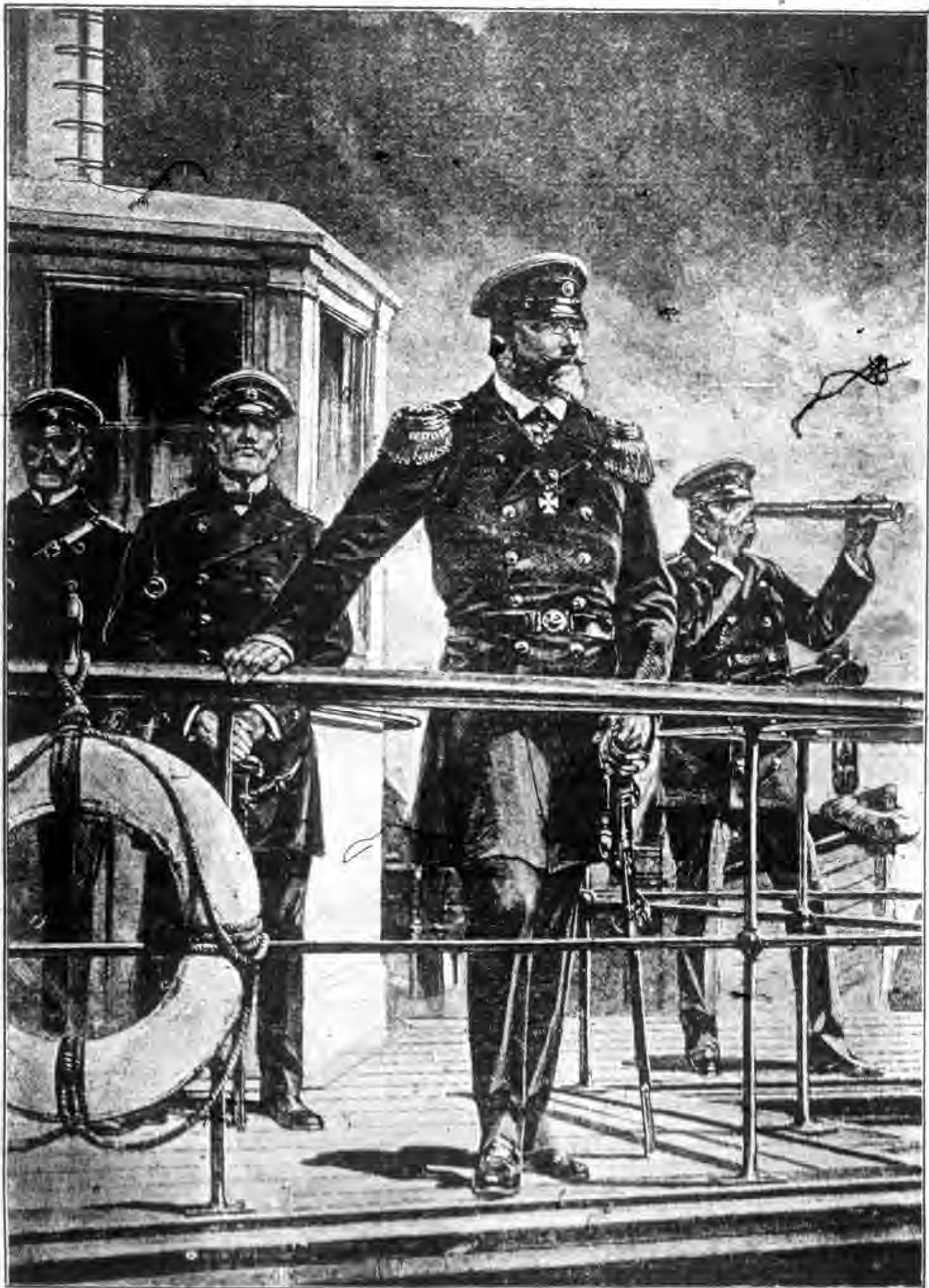
俄將司廓理羅甫出海探敵圖