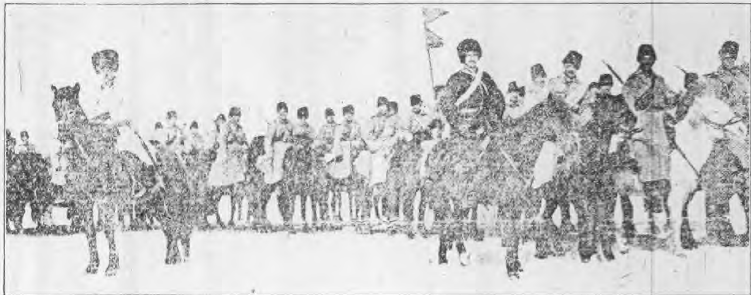
俄國貝加爾哥薩克兵隊渡冰圖