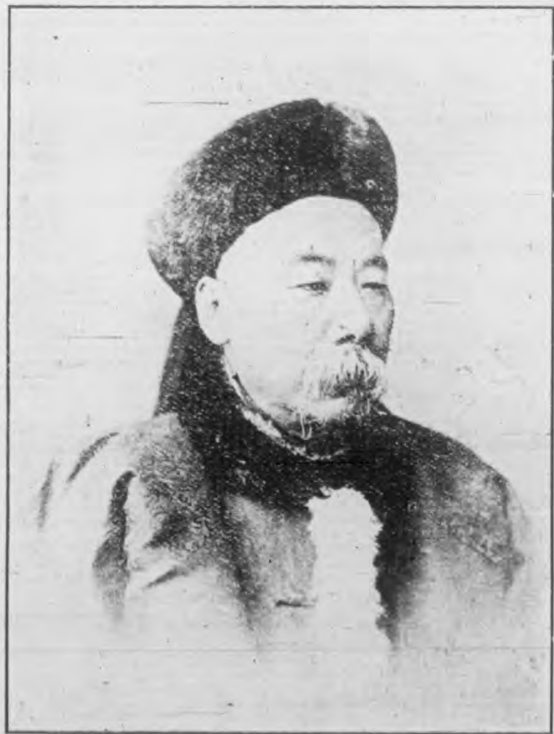
商大 臣工 部尚 書呂 公海 寰