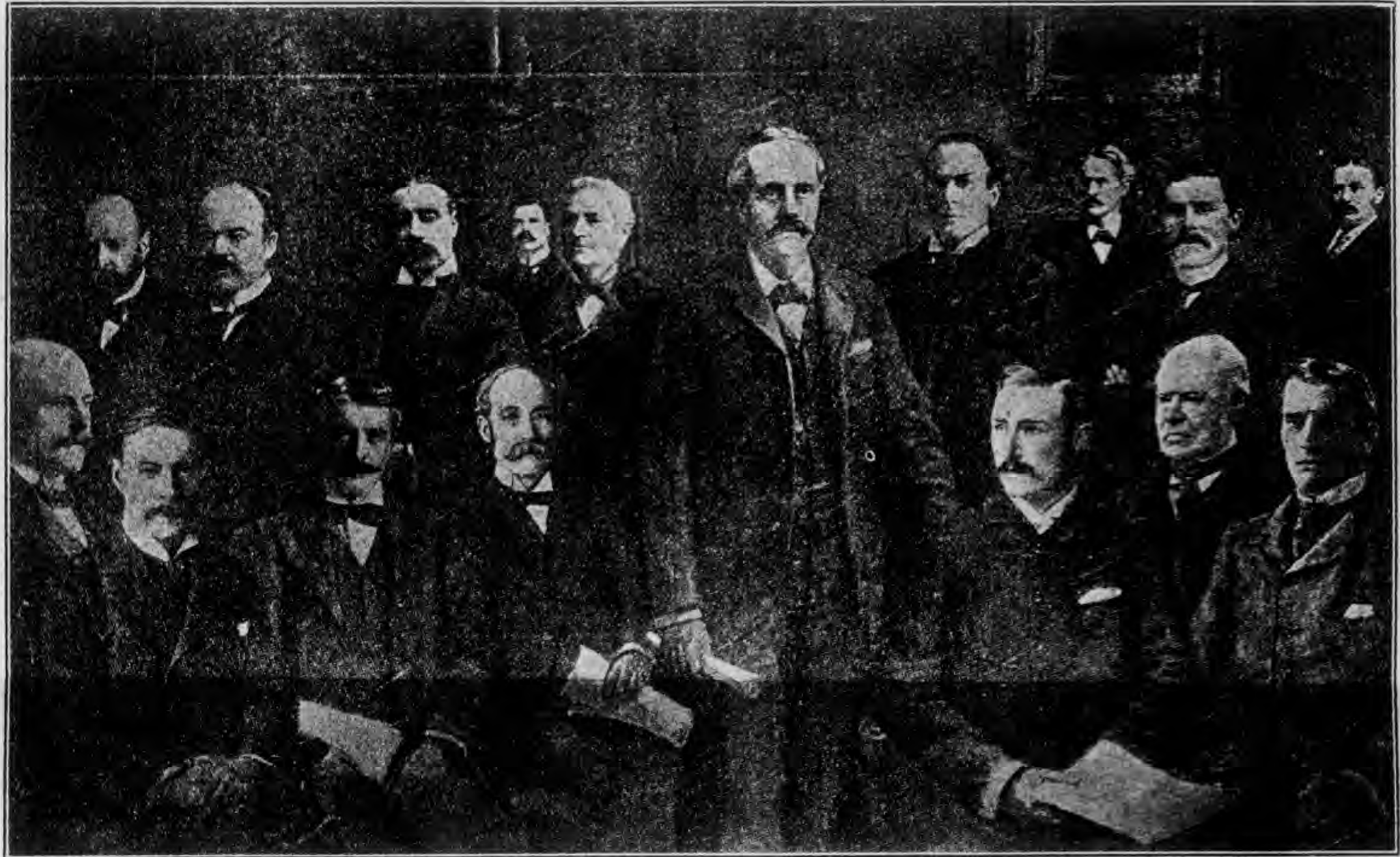
羅司安臣大部農 亨槐臣大部蘭爾愛 來坦司臣大政郵 福爾貝相首國英 福爾巴臣大部商 斯拉格德臣大務內 期爾華書尙部政行方地 來特敦倫臣大部學 朋斯愛官法總部蘭爾愛 賴爾脫賴臣大部藩 克特羅勃臣大部度印 排司亨官法總院議上 達斯福臣大部兵 朋爾賽臣大部軍海 倫伯張臣大支度 雷邁臣大部蘭格蘇 當斯藍臣大部外