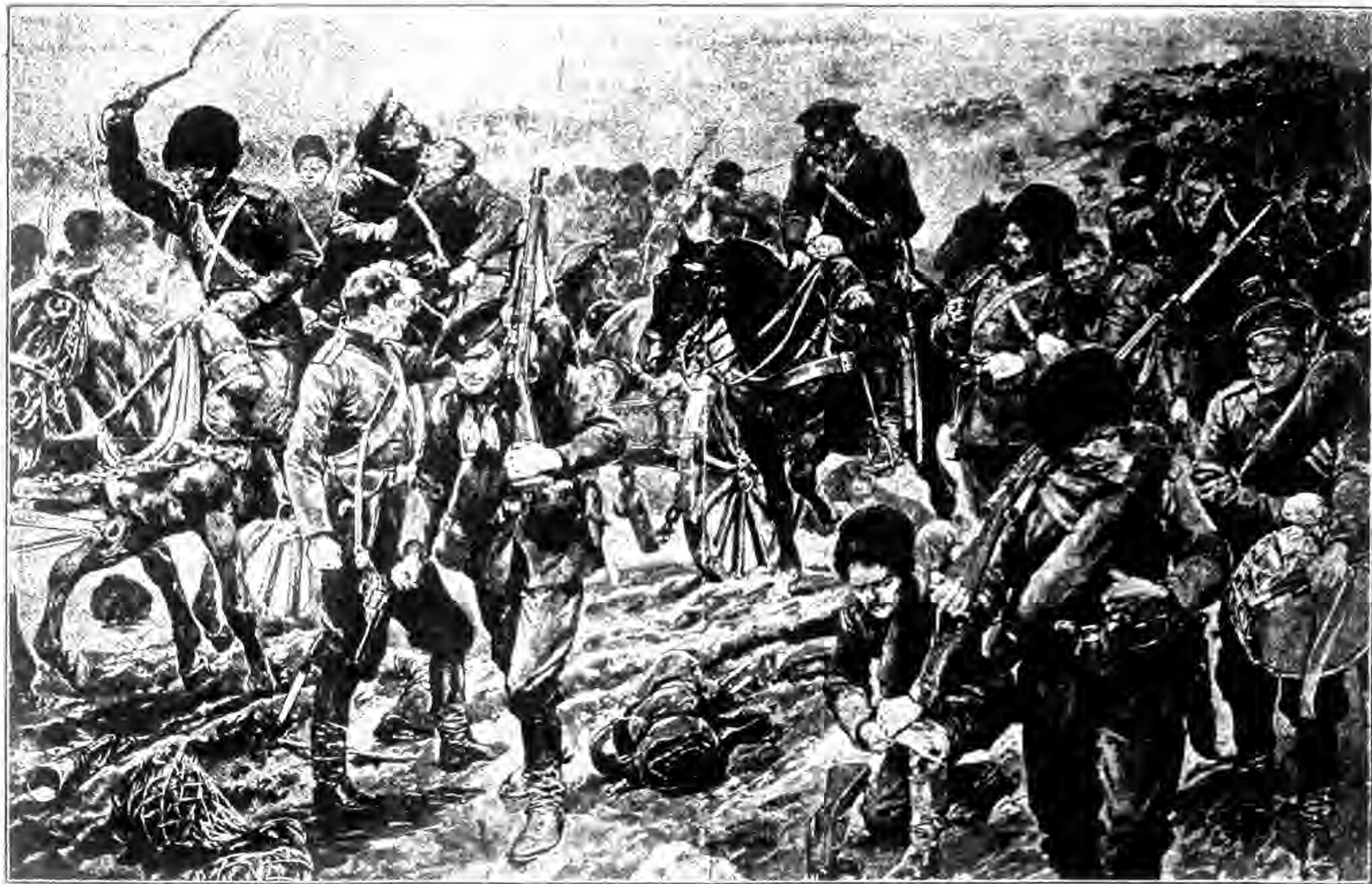
圖 城 風 早 入 退 城 連 九 自 軍 後