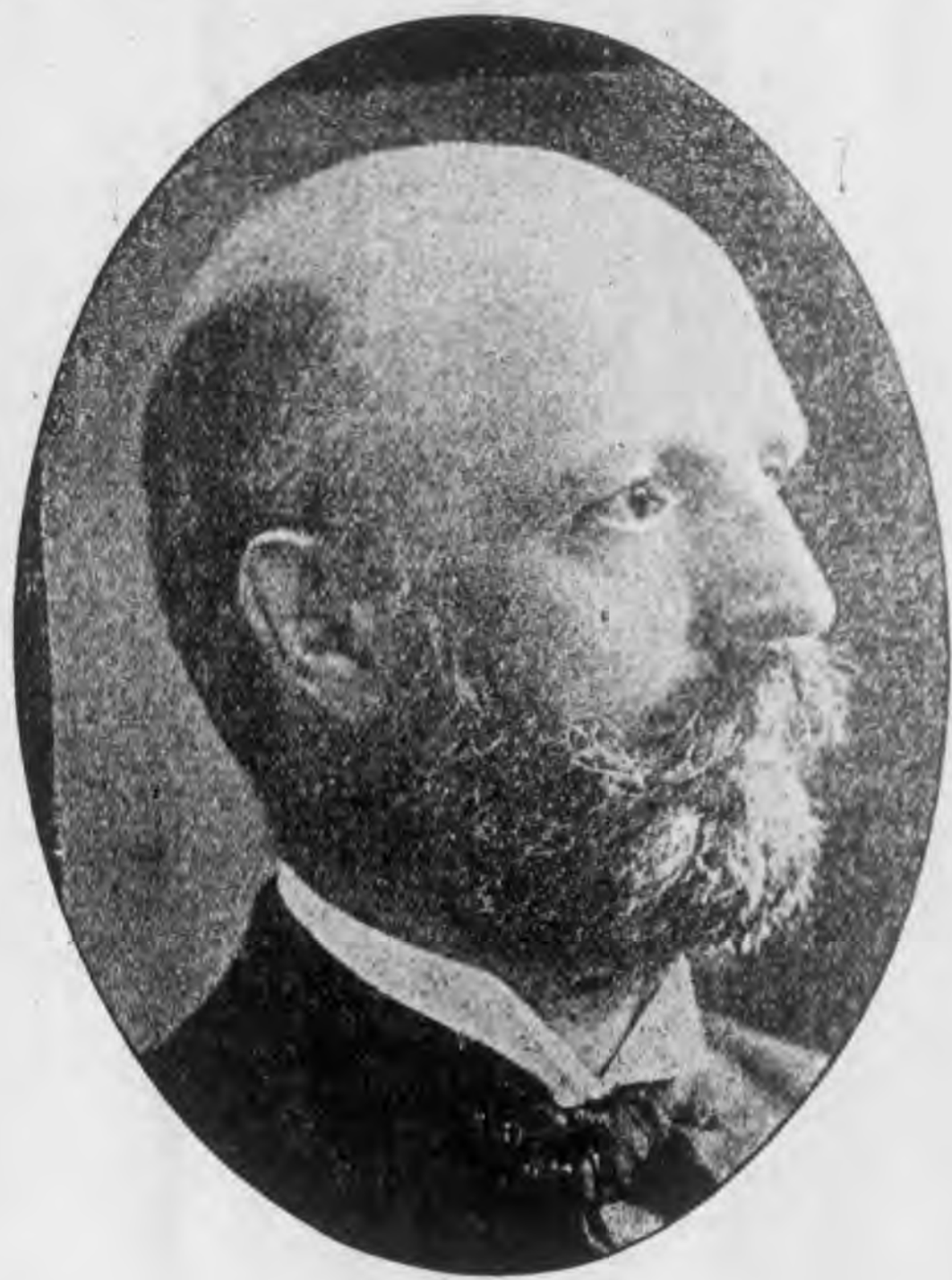
君克司賴伯臣大部戶任現俄