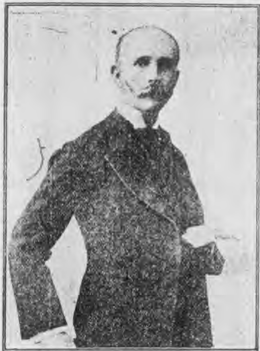
君脫孟賴臣大省藏大哥西墨