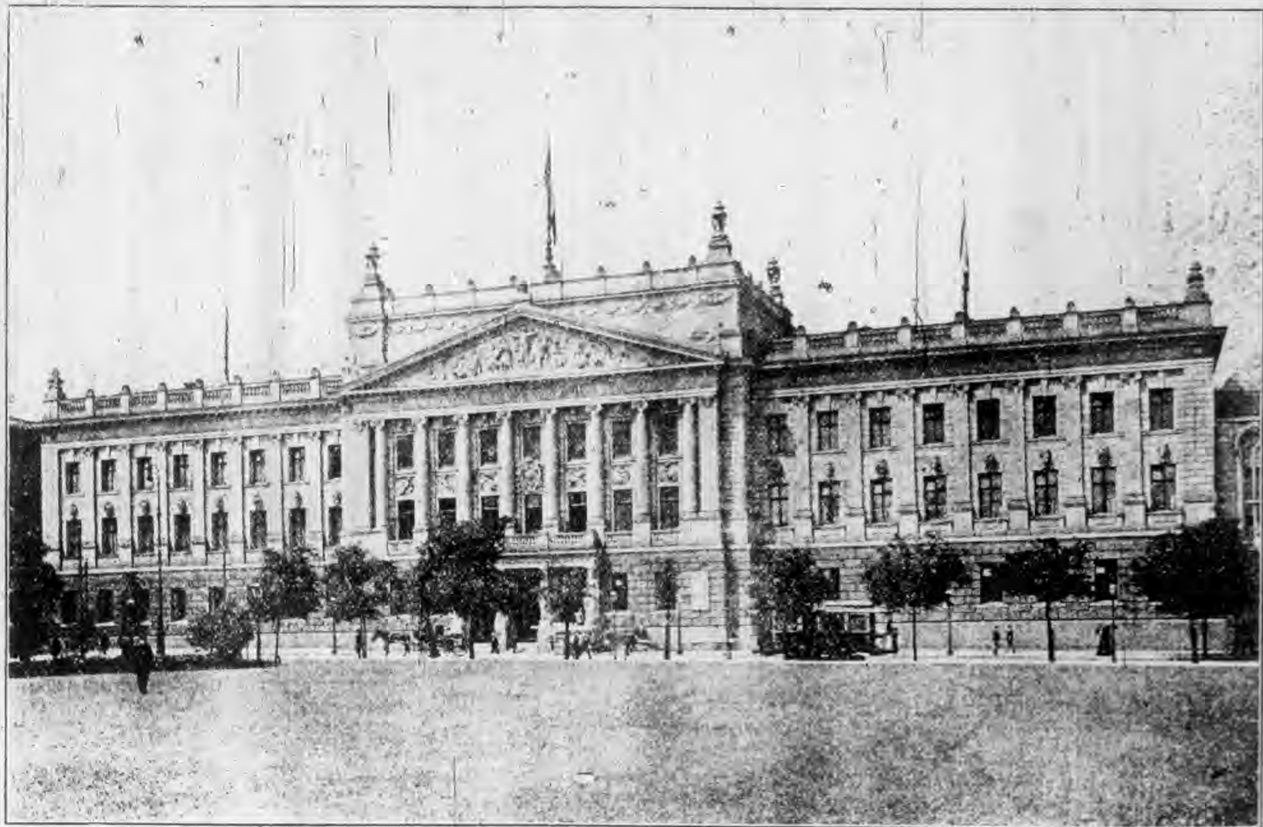
德國來自的希大學校