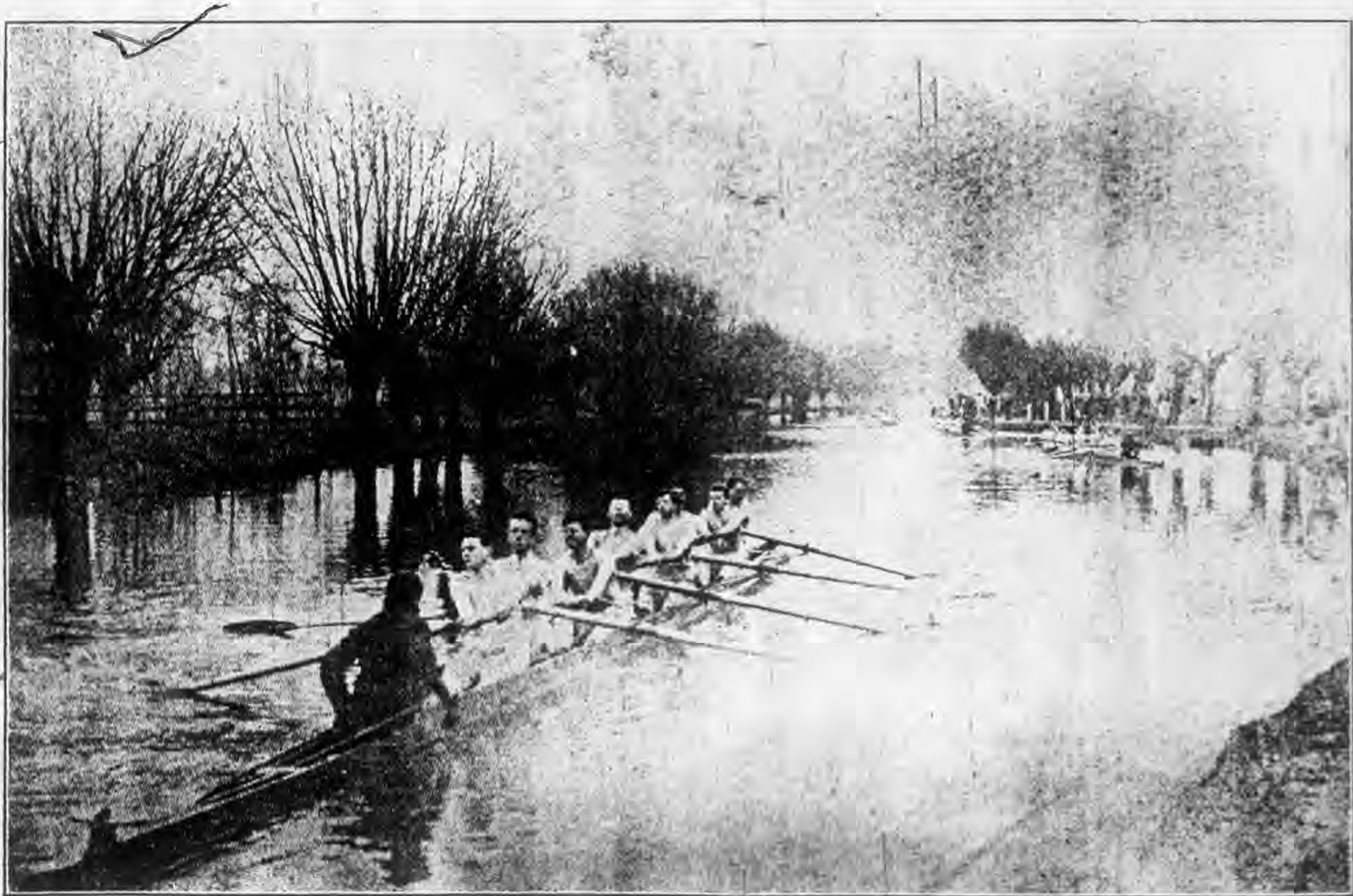
英 國 坎 丕 立 治 大 學 校 賽 船