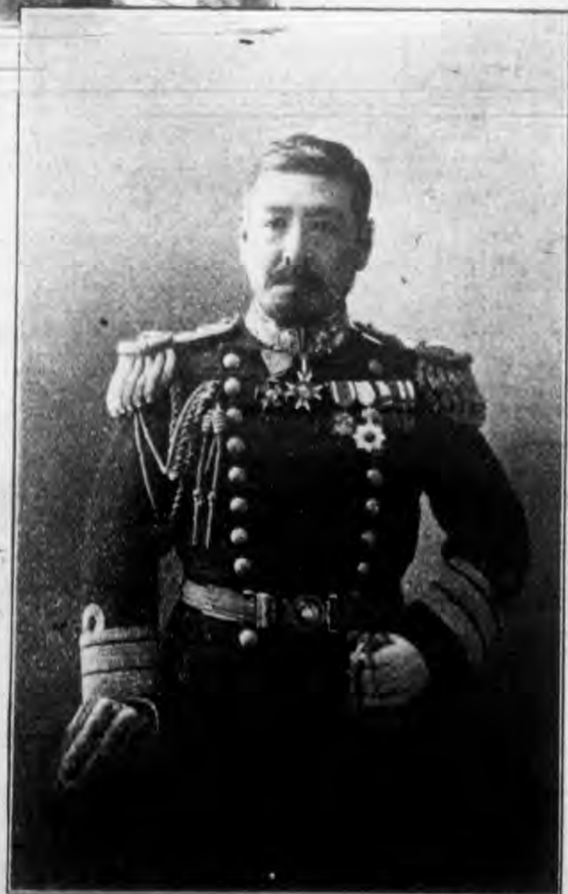
路正鄉東 將少軍海