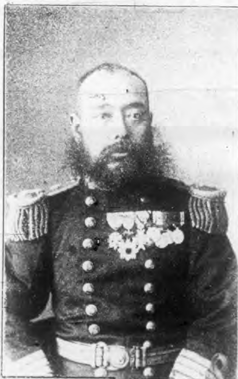
海軍少將 梨羽時起