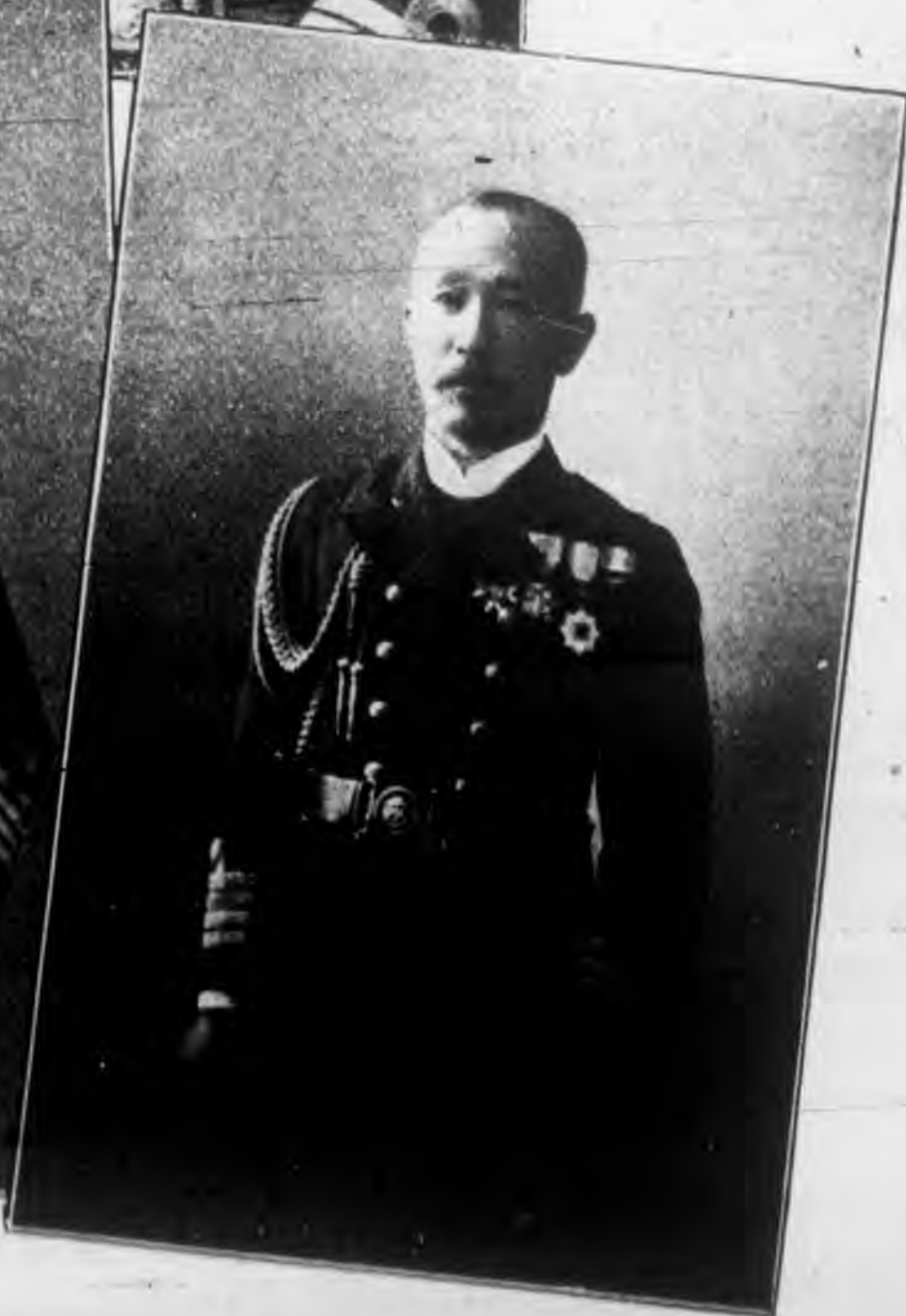
常備艦隊參謀長 海軍大佐 藤友三郎