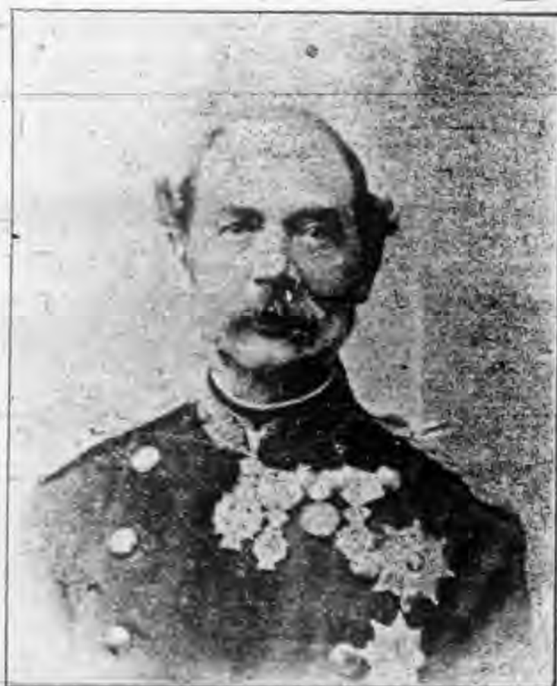
九第坦斯力查王麥丹