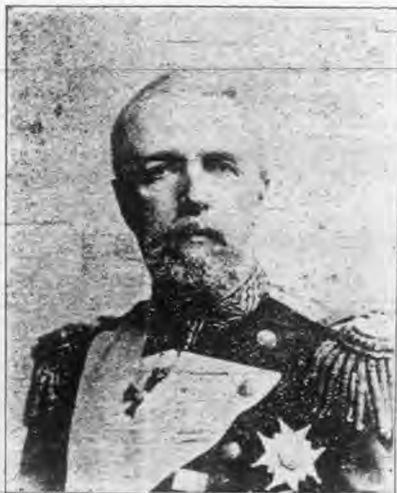
二第加司沃王威璦典瑞