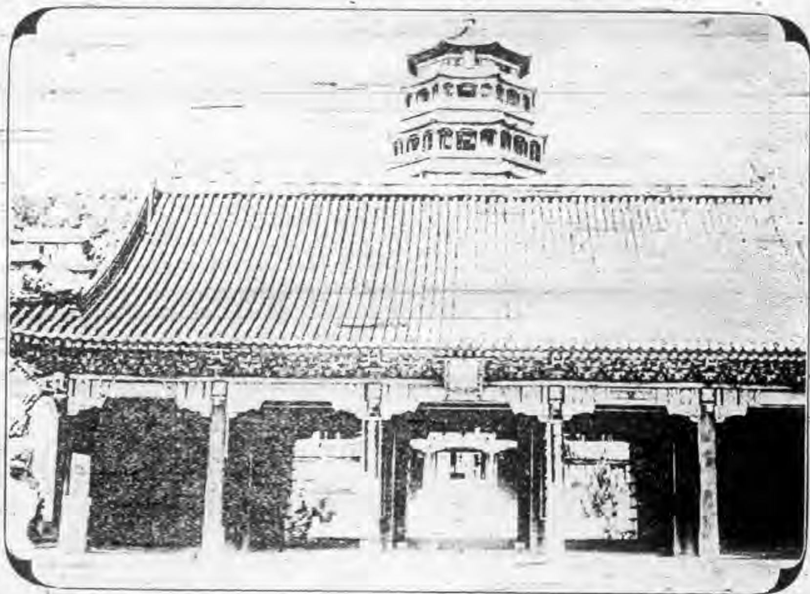
船 石 內 園 和 頤