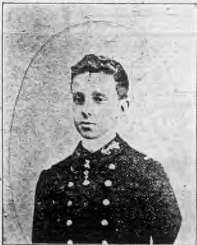
三十第璜芬阿王牙班西