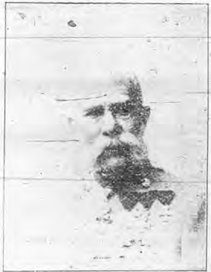
奧 皇 佛 蘭 約 塞 第 一