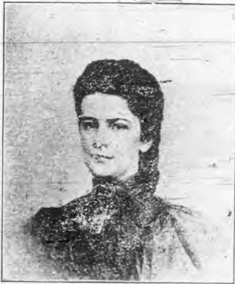
奧 故 后 依 拉 薩 白