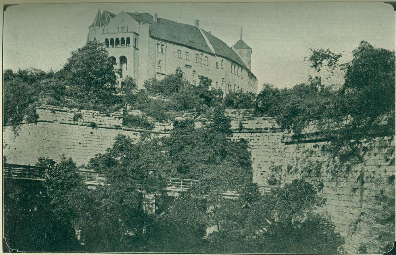
城 意 倍 倫 義 國 德