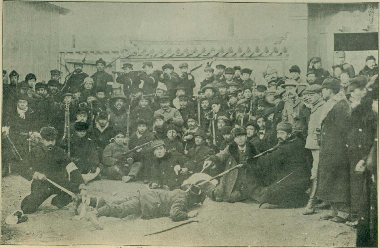
駐 營 口 日 本 義 勇 隊