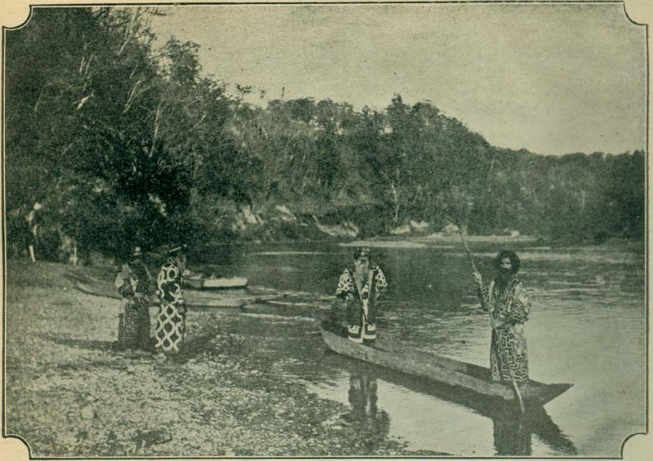
日本北海道之愛奴人