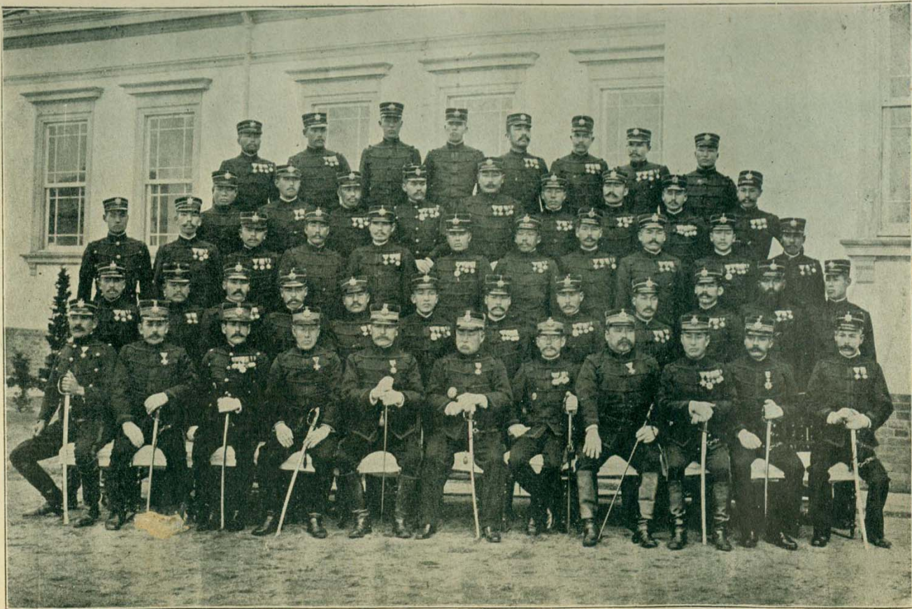
日 本 第 一 師 團 武 官 一 隊