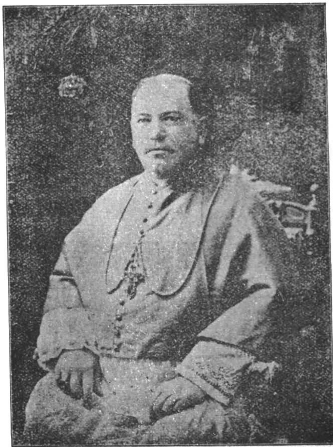
爾 納 康 奧 正 僧 大 馬 羅