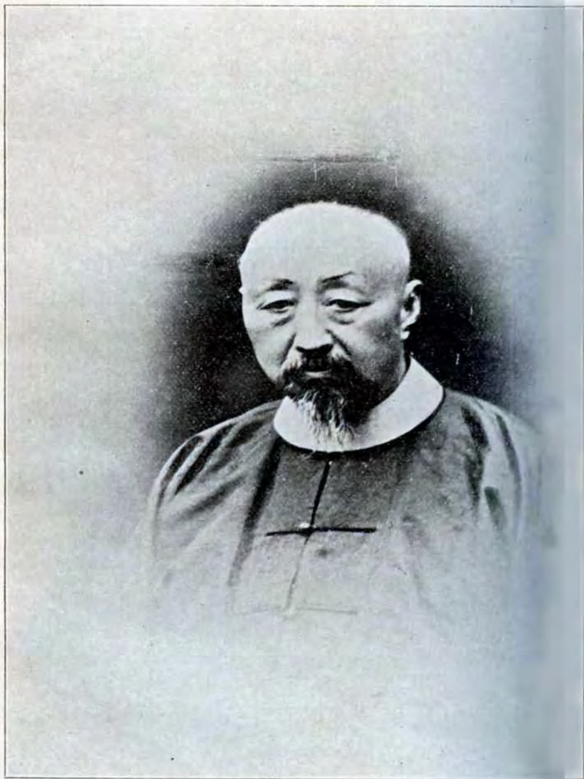
憲重郎侍吳郎侍左部傳郵