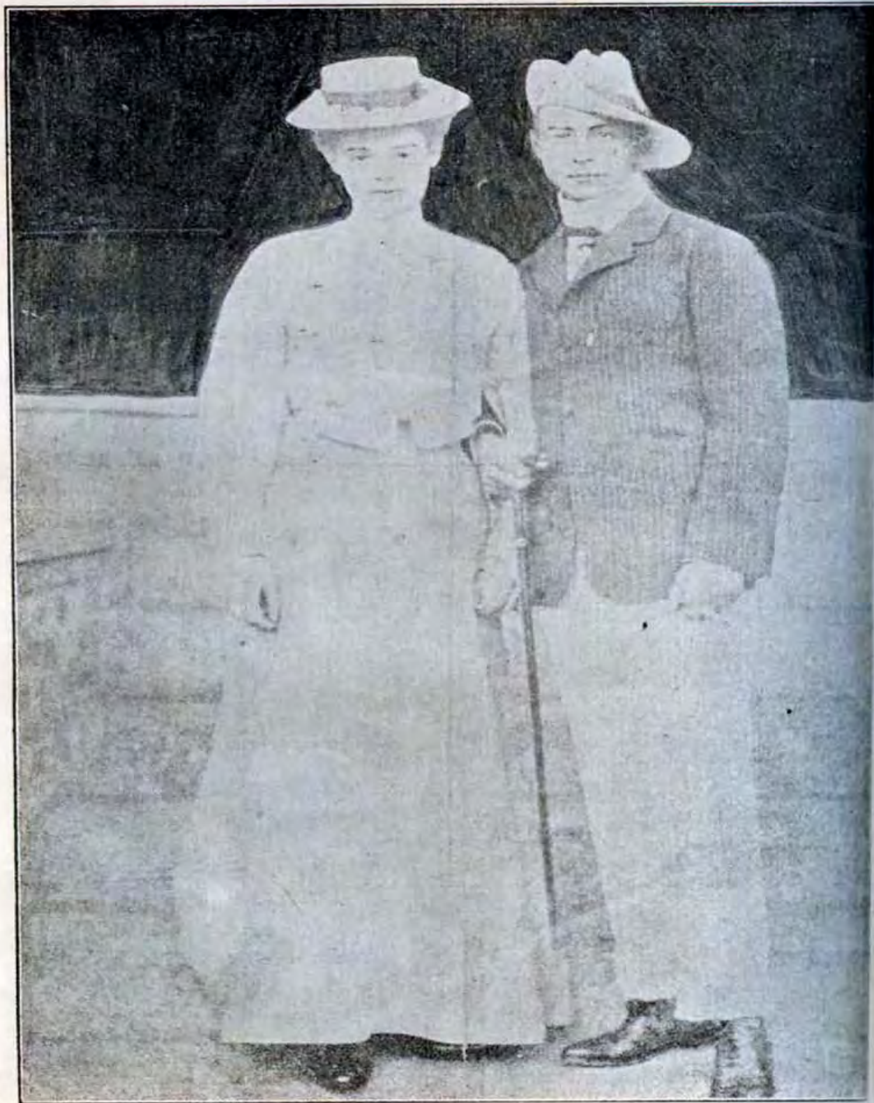
德 國 太 子 及 其 妃