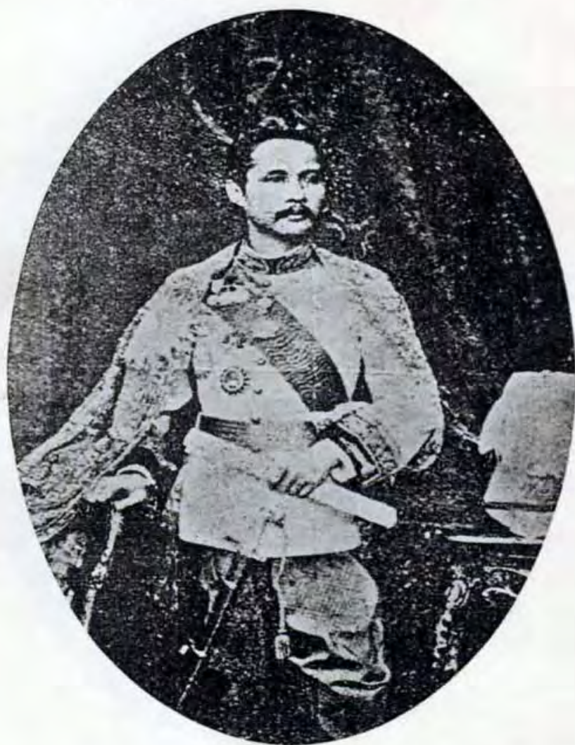
暹羅國王拉克朗康