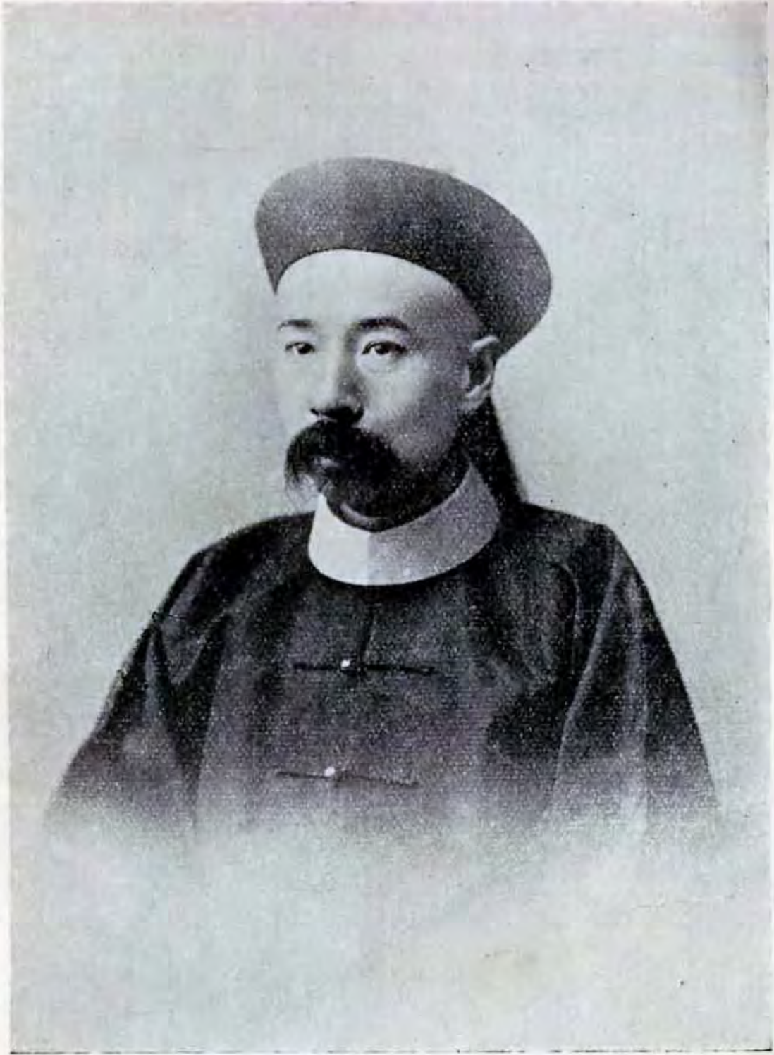
英 紹 郎 侍 左 部 支 度