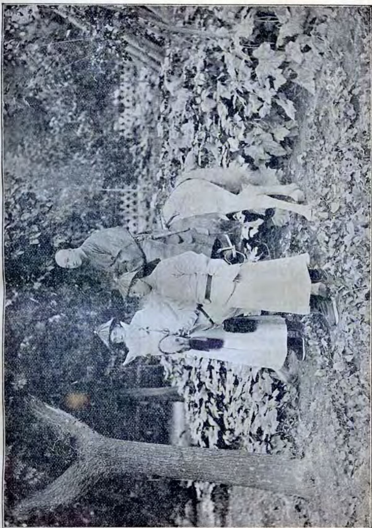
衍聖公孔令公上孔公聖衍