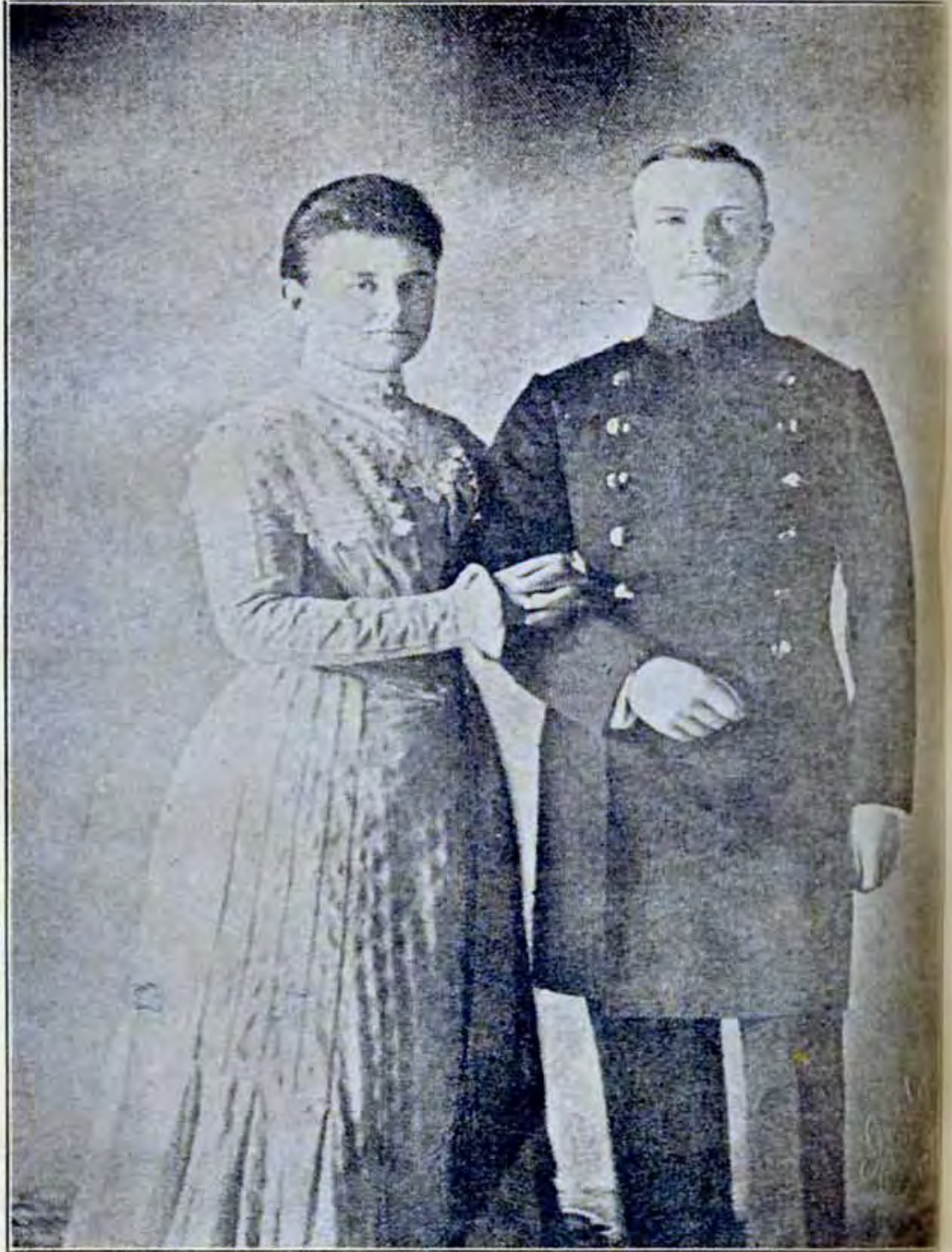
荷蘭女王威爾密爾及其夫亨利公爵