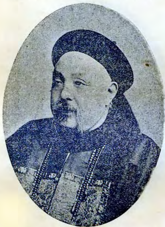
署山東巡撫袁中丞樹勛