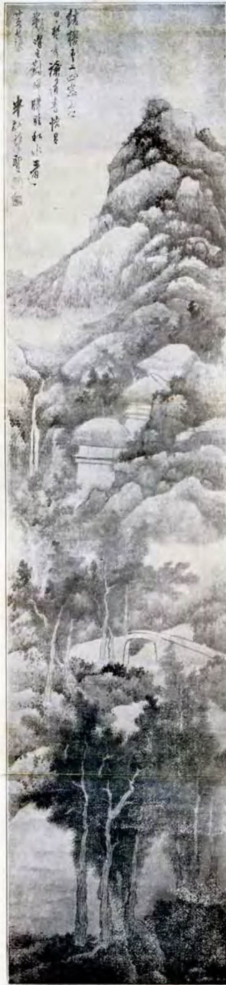
畫 賢 巖