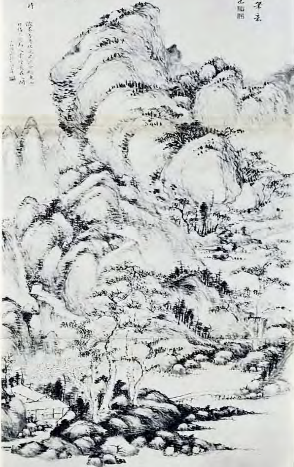
畫 山 東 董