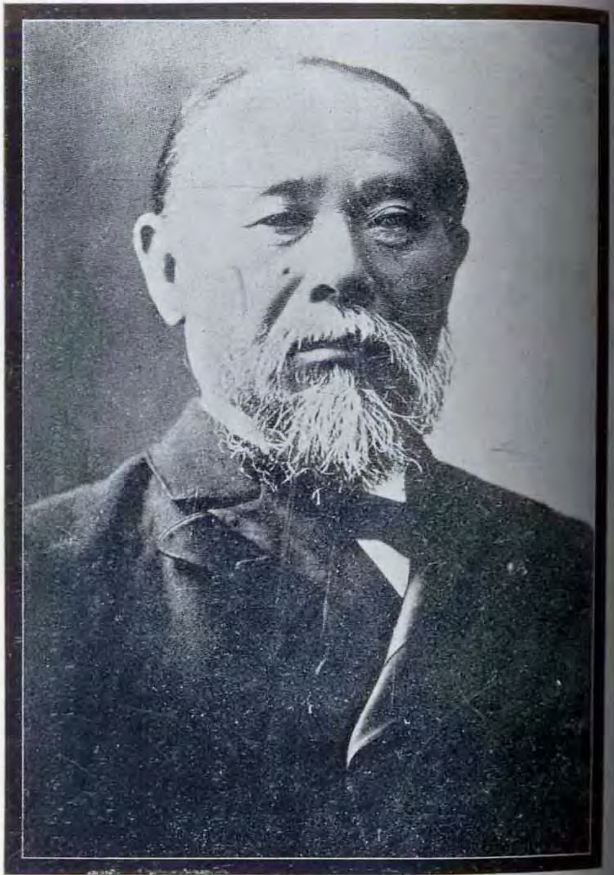
日本伊藤公爵遺像