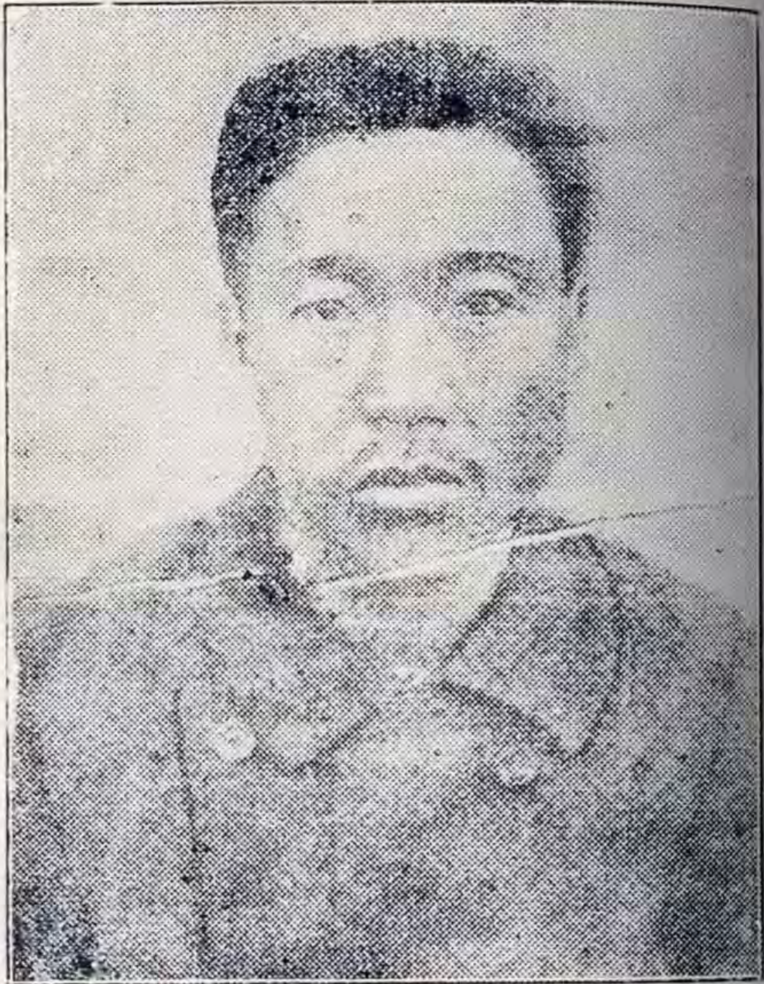
韓 國 刺 客 安 重 根 像