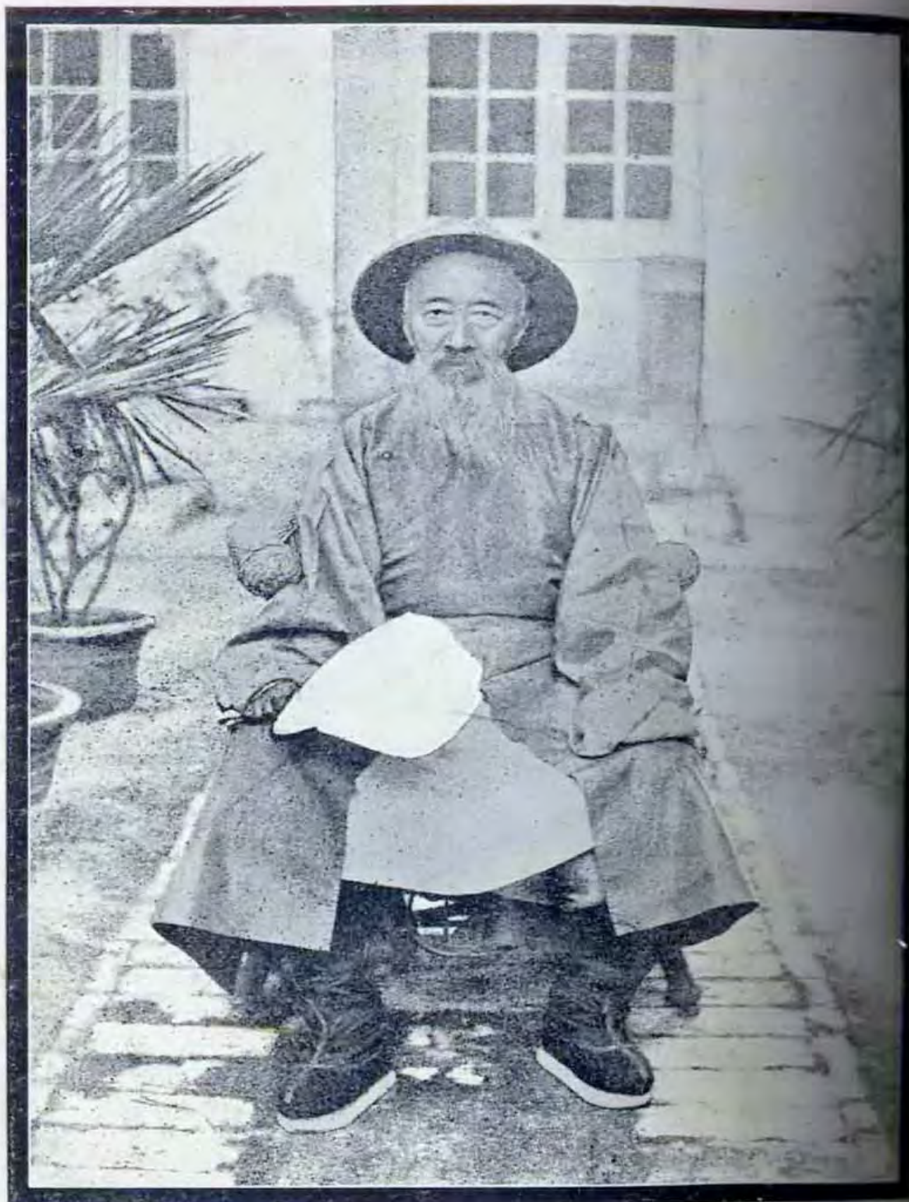
張文襄公晚年小像