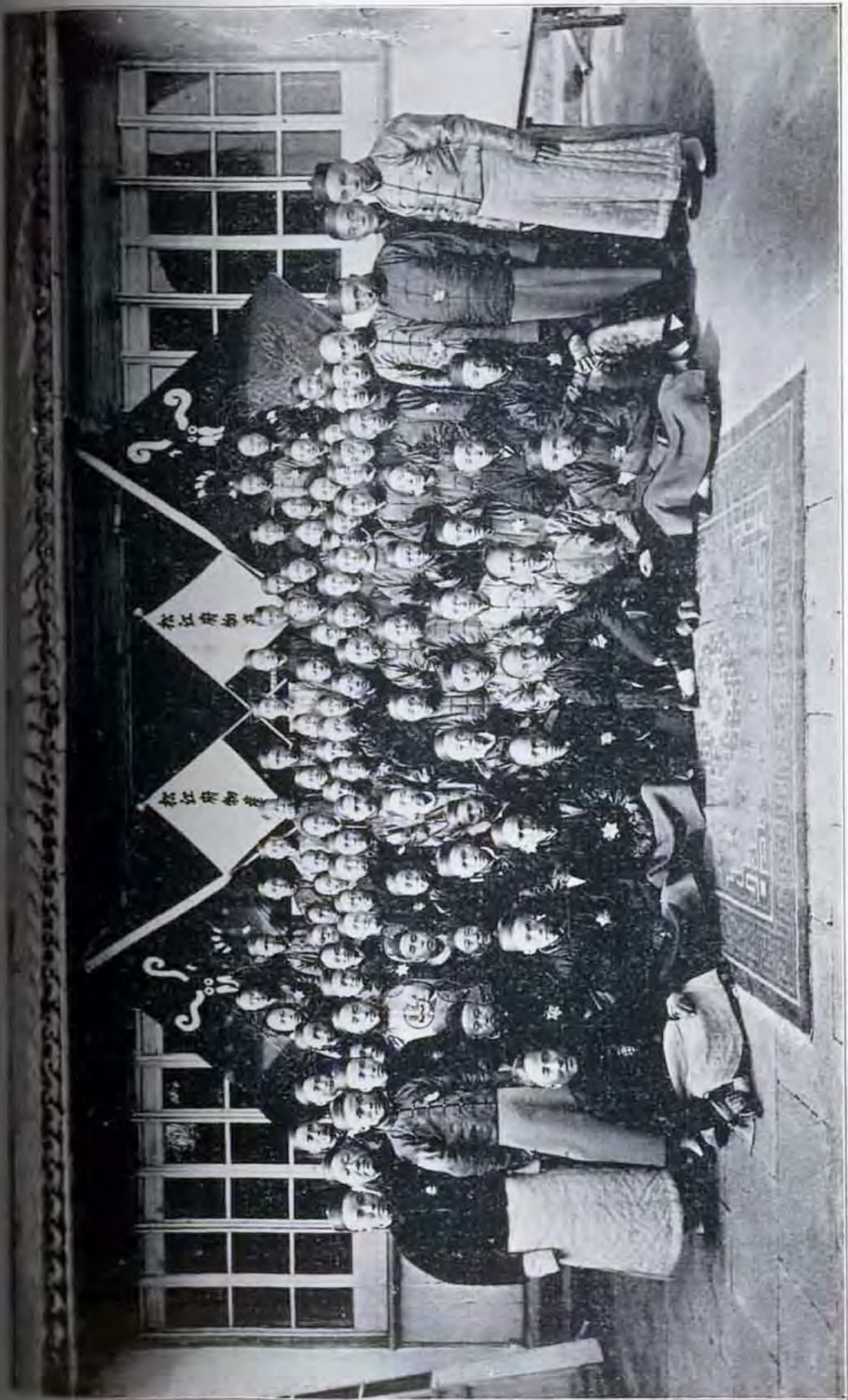
松江物產會場會圖