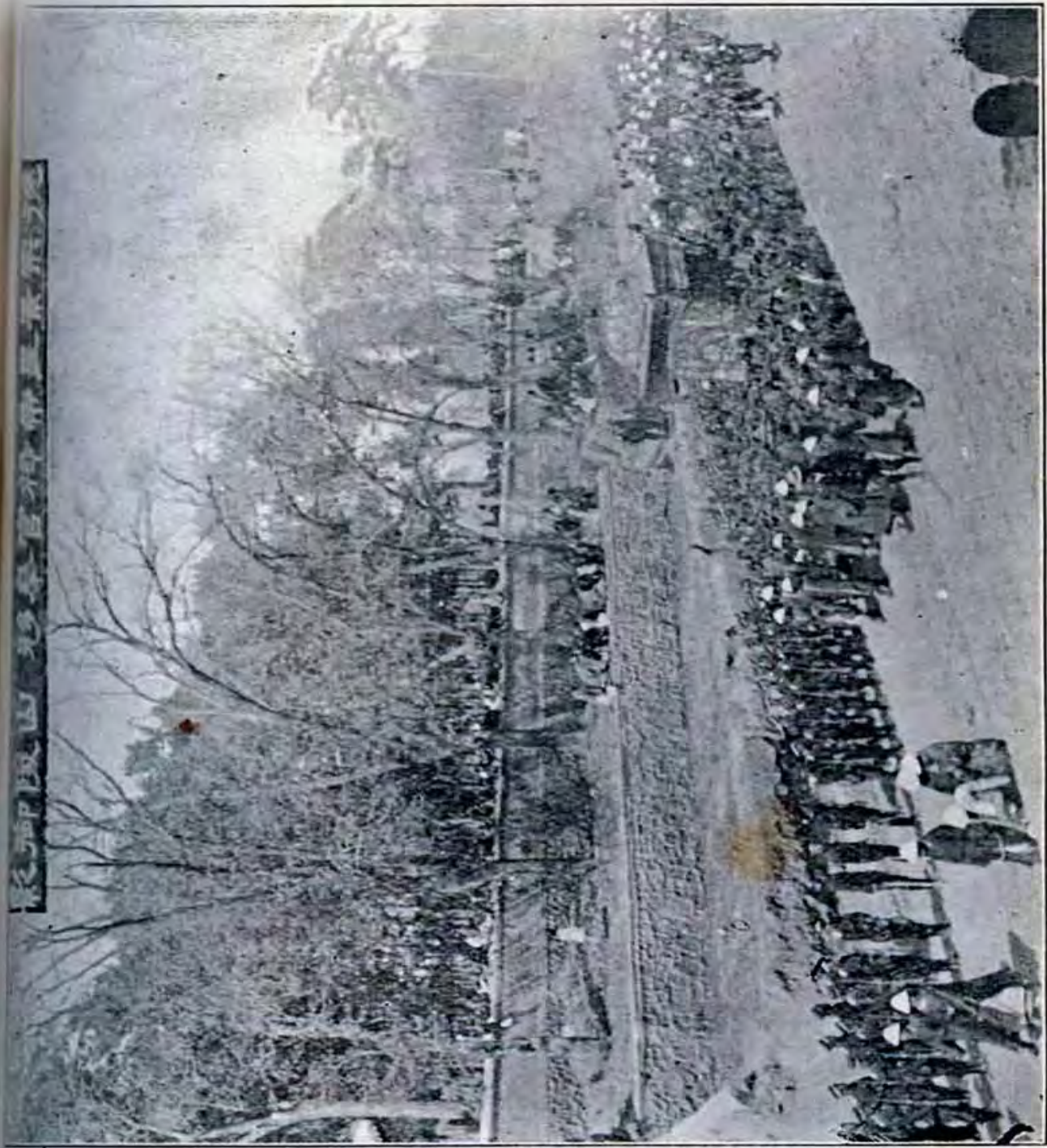
德宗景皇帝梓宮奉移撮影