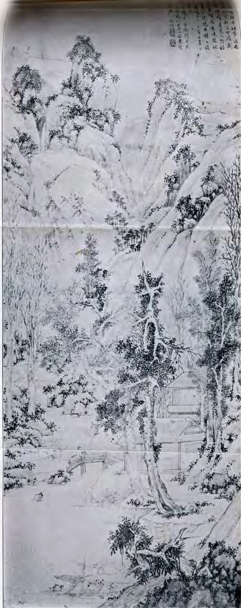
文 待 詔 畫