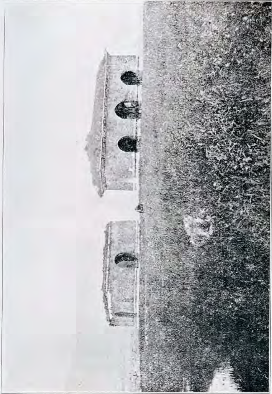
城 方 四 陵 金