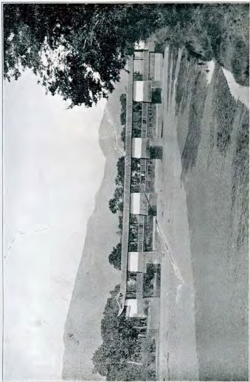
雲 南 臨 安 府 十 七 孔 橋