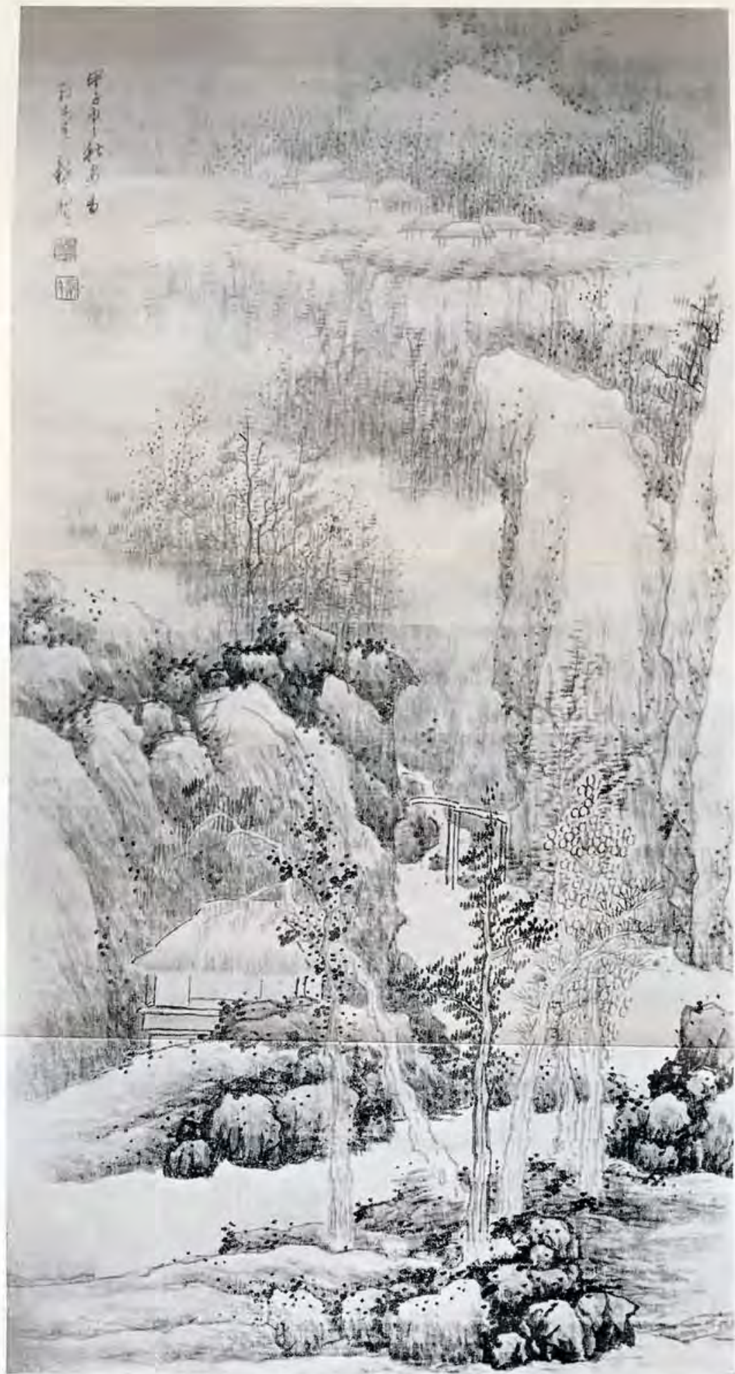
飛 賢 之 畫