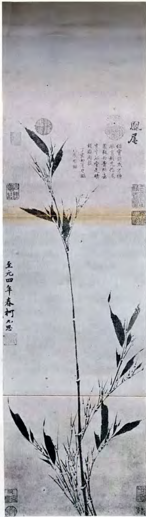
畫 思 九 柯