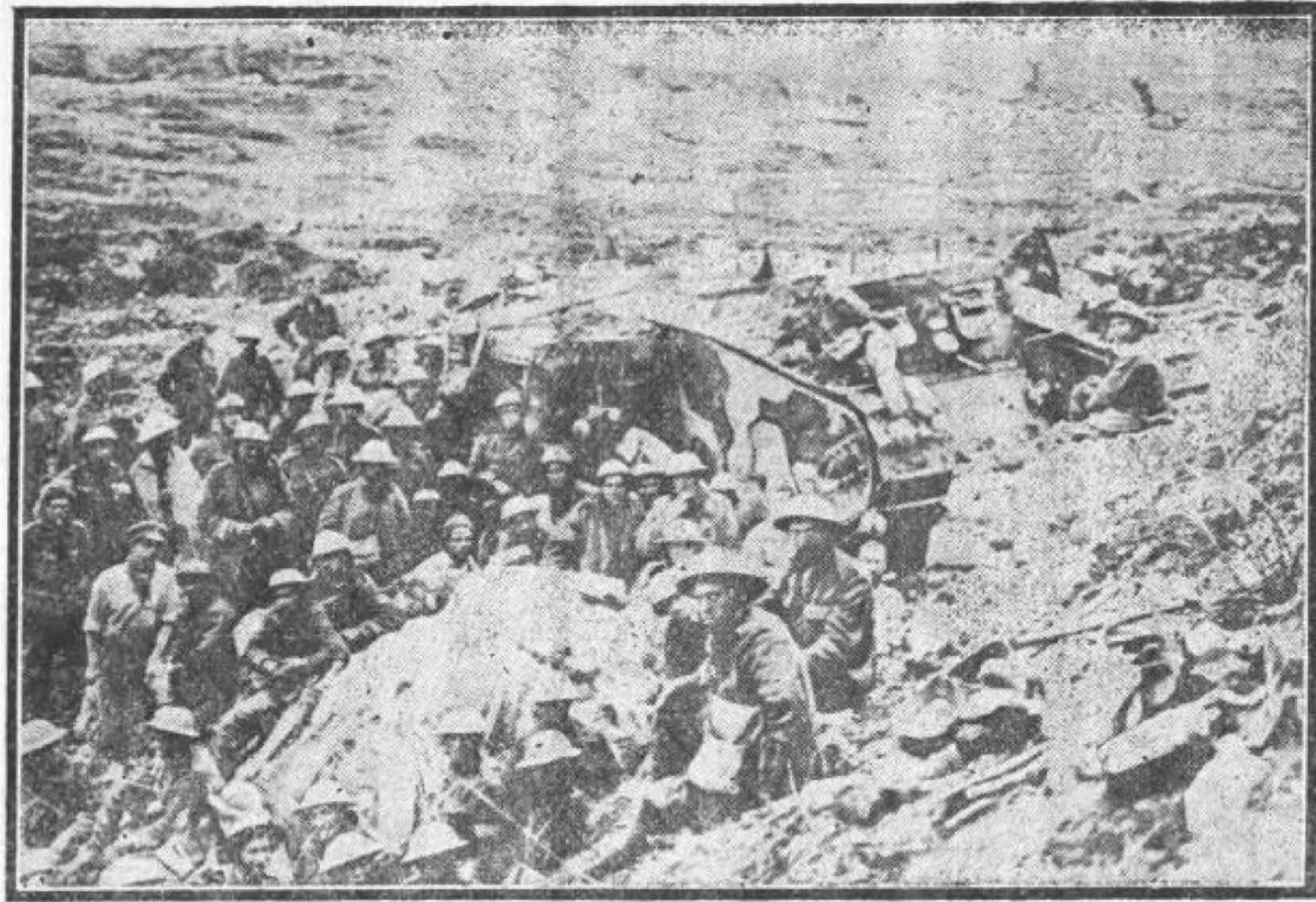
坦克大礮停止時之狀

機。按此種發動機。在機械學上。最占重要。如汽車飛機潛艇飛艇。皆利用此項發動機而成。製成耕車。以供農作之用。此種耕車。能力極大。能耙平極堅之土壤。大戰開始。裝甲摩托車。在軍事上。應用最廣。然以此種摩托車。非廣衢大道。不能通行。且破壞力未及大礮之猛。故其用未溥。至最近坦克大礮發明而後。軍事上乃獲一最猛之殺人器矣。