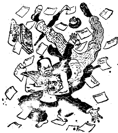
遠東舞台上的角力。

他來作無益的犧牲，捷克的悲劇，就是這樣造成的。我們的抗戰，有正大光明的立場，已經有了兩年以上堅忍獨立的奮鬥，我們可以相信，世界友邦正義的權威，正在蓄積增長，到了時機成熟，一定能共同一致，作最有效發揮。就我們自身來說，我們始終相信「自助者人必助之」的格言，無論軍事外交經濟，我們自始就決定要以自力支撐獨立，奮鬥到底的。有友邦來援助，當然希望愈多愈好，沒有援助，亦更要堅志奮鬥到底的。我相信如果我們本身能自強，能健全，決沒有一個朋友會丟開我們，辜負我們的。我們得到多助，任何友邦，決不致為×人的威脅利誘，而改變其向來對華之根本政策的。×人的妄想和宣傳，實在不值我們的一笑，我們即使撇開法律和道義不談，祇就利害立論，亦深信英國決無對日真正妥協的可能。英國認識日本比我們認識得更清楚，英國已明明知道今天的日本，已不是二十年前替他在遠東看門的警犬，而是在太平洋上來反噬它主人的一條瘋狗了，英國又如何能放棄