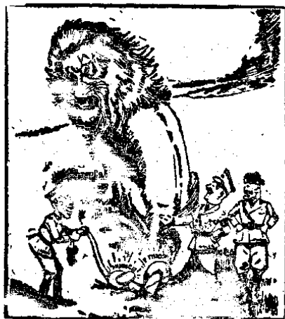
這只雄獅能長此受人挑釁而不怒吼嗎？

們國民不要為漢奸邪說所搖惑，而生憂慮，祇要我們有精神有主義，那麼英日東京談判以後，我們抗戰的力量，不但可以加強，而且必更能持久，尤其不可忘記的一個特點，我們是一個革命的國家，無論遇到任何艱苦，都要有獨立奮鬥的決心，而決不稍存倚賴和觀望的心理，要知倚賴心理，為我們革命精神所不容。 其次說到經濟和金融，我們經濟基礎實在是在比在南京時候更加健全，最近因為×僞的加緊搗亂，外匯比率為上海黑市場投機者利用操縱，前幾天有一時搖動的現象，但我可以告訴我們全國的同胞，政府必定是始終維持法幣的價格，供給合法的外匯，施行適當的管制的，而且我可以對我們同胞說，政府已有確定把握，來鞏固金融的基礎。關於外匯的管制，政府已研究有更完密而妥當的整個辦法，正可以乘這個機會，來求得根本的穩固。至於在上海租界內，因為有×人在背後搗亂，又有投機者操縱市場，我們向來就不主張無限止的借給外匯，以妨礙戰時的金融。須知我們抗