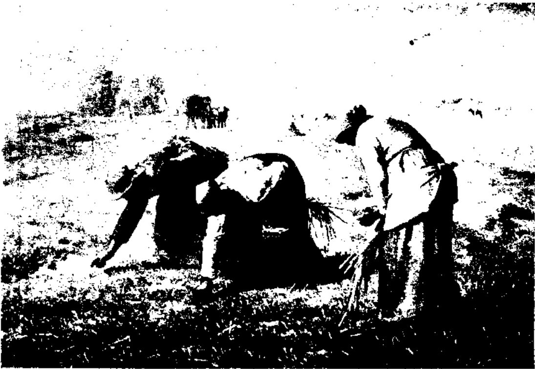
(四) 彌納之繪畫『拾稻』