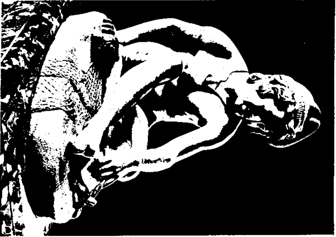
(一) 許德之彫刻『漁童』