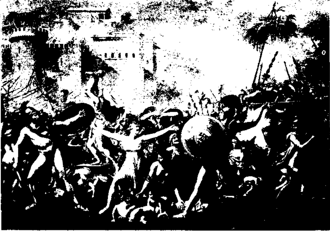
(三) 達維之繪畫『弭兵』