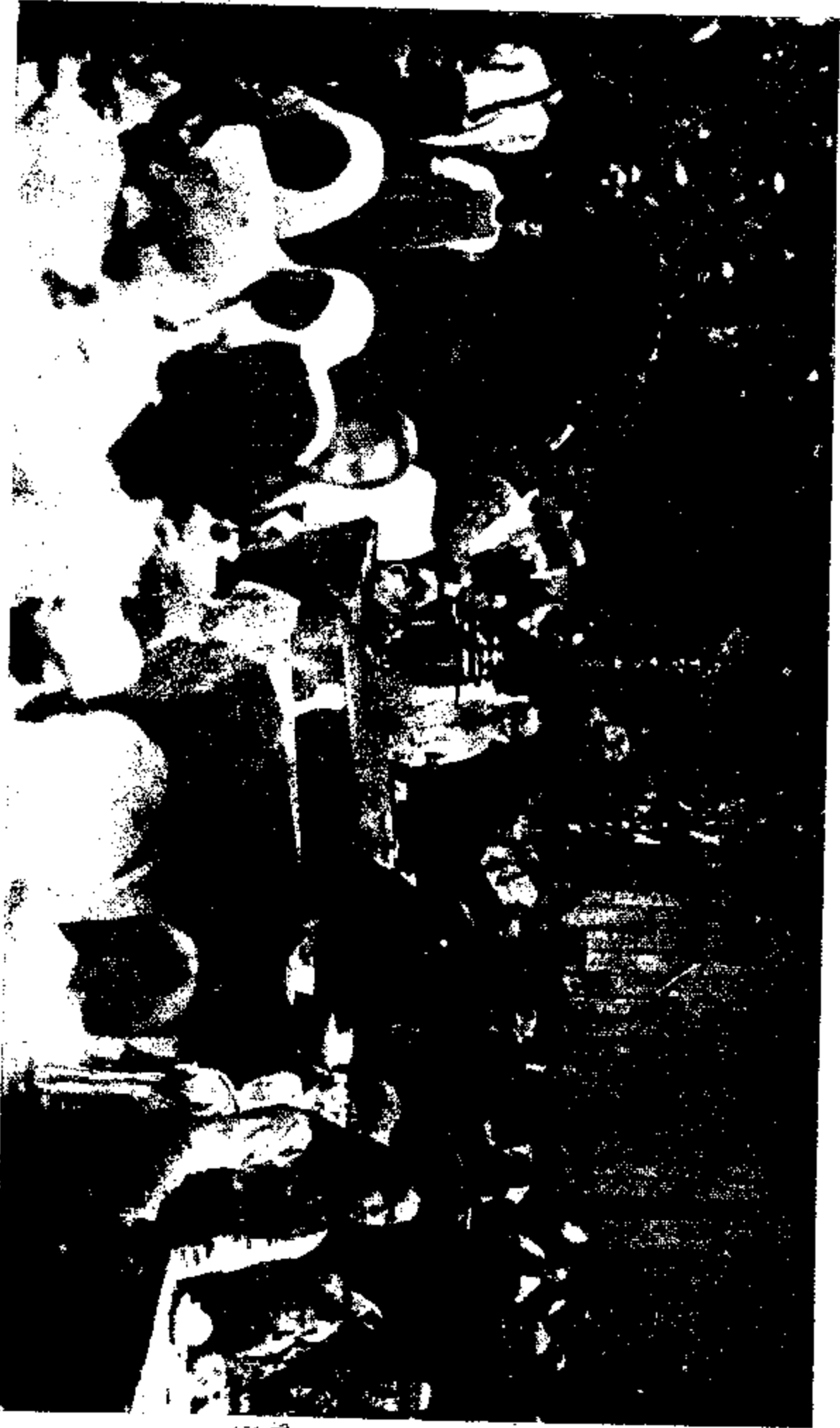
Tolstoi beim Tee mit den Bauern im Jahre 1909

此為脫爾斯泰與農民開茶話會之圖。端坐棹中白衣而長鬚者即為脫爾斯泰。時在一千九百零九年。次年十一月二日此社會偉大人物遂與吾人長別矣。