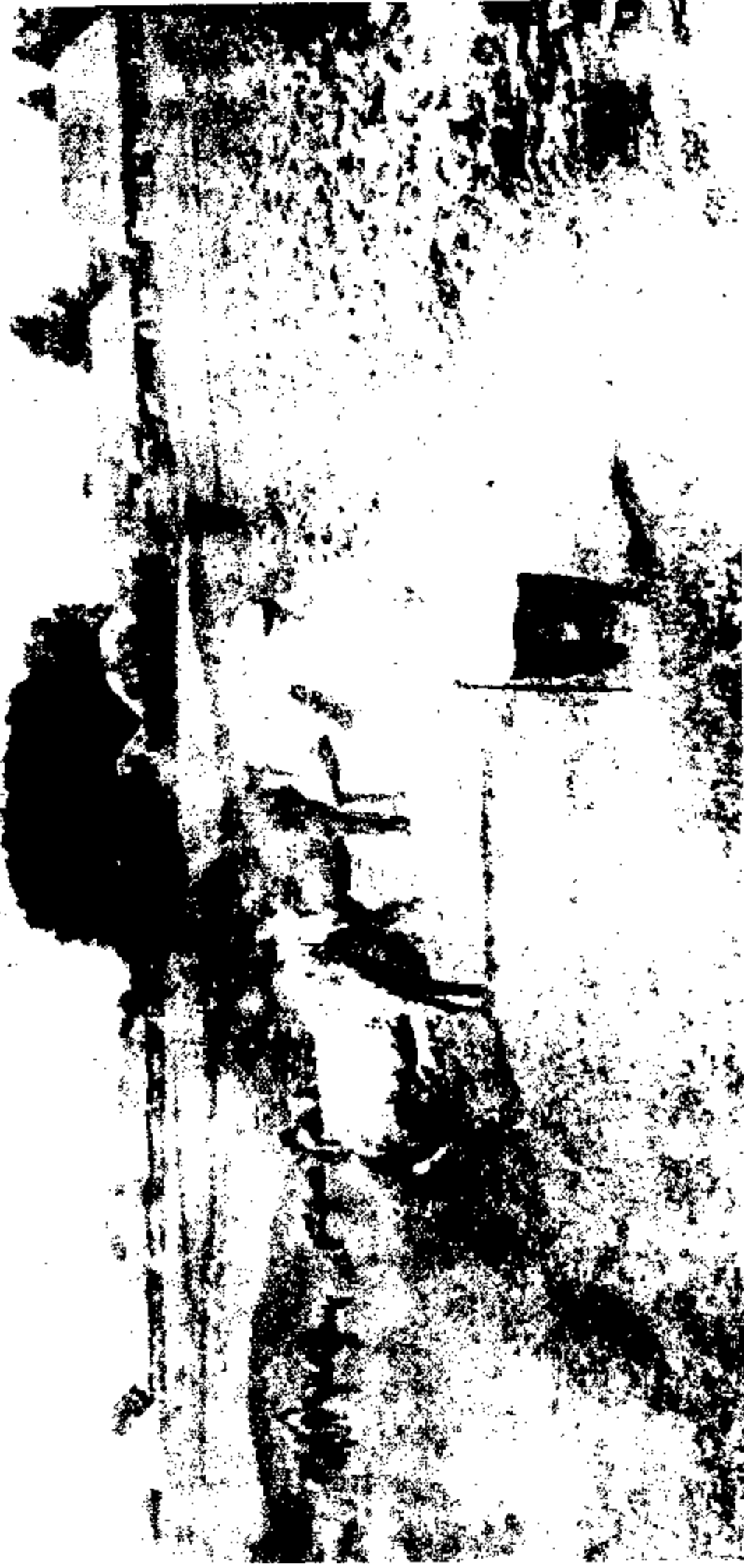
社會活動先覺俄國脫爾斯泰帶赴鄉村宣傳主義改造農民 思想圖中獨行踽踽者即脫爾斯泰赴鄉村時途中之情形也