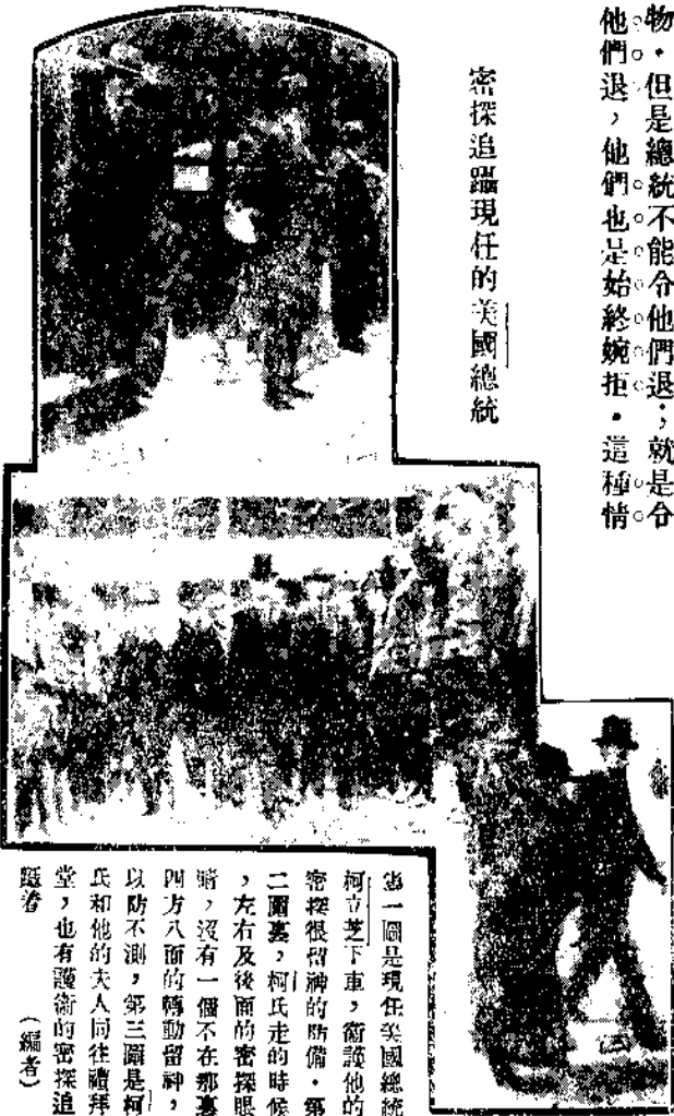
密探追蹤現任的美國總統

形，在我們局外人看起來，真是極奇！平民總統的生活居然含有這般奇特的情形！ 平民總統也這樣不自由，我覺得人們不做事則已，做的事不大則已；否則「有友亦有敵」。 再進一步說，做大事總要冒幾分險；就個人方面說，倘若果有能力替大多數人謀幸福，對於大多數人有貢獻，就是冒幾分險，也是值得的。