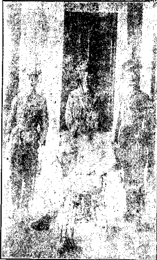
先生後面 中立的是 蔣介石總 司令。其 右立的是 革命軍第 一路總指 揮何應欽 。其左立 的是長江 要塞司令 王柏齡。

們現在敬仰他的博學，要知道他的博學不是一朝一夕得到的，是這樣在博學的時候也是完全出於求學的誠意。這個時候他完全出於求學的誠意！這個時候他完全出於求學的誠意！這個時候他完全出於求學的誠意！