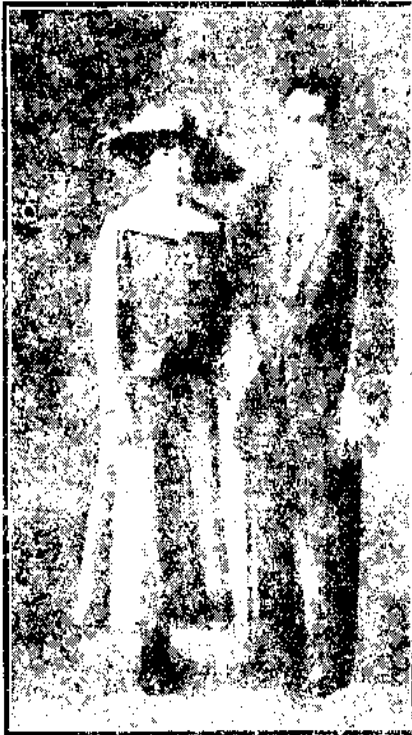
中山先生於民國三年（時年四十九歲）與宋慶齡女士在日本結婚。女士浙江人，曾留學美國，畢業於威爾斯連女子大學。民國元年先生在南京任臨時總統時，女士即任先生秘書。先生之西文著作，多由先生口述而女士紀錄。我們希望孫夫人始終遵守先生遺志，為國努力。編者

謝不敏，立即辭職。恩女士當然和他相處不來，只得「急流勇退」。女士以為無論什麼機關，同事間彼此須有相當的情誼，如專用威勢，決不能持久的。據他所調查，他的意見果然不錯；因為不到幾年，那個公司裏那位領袖，