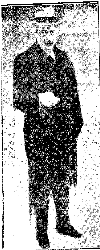
◀ 影宵斯爾威 ▶

他的意思，所謂成功並不是一個籠統的名詞，譬如我們有十分力量把一件事做到十分好的地步，真把這十分力量用了出來，真把這件事做到能做的好的地步，便是成功。如果只有五分，便有五分失敗；如果只用三分，便有七分失敗。這樣說起來，我們