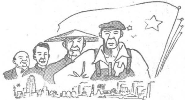
資族民及私階產資小，級階民農，階階人工②个 。線戰一軌的了成權級階產