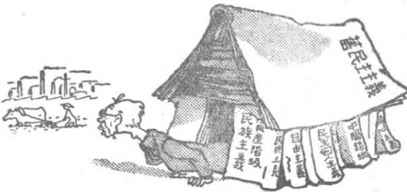
指者知先向下導指的袖領民人在⑧ ↓ 進過路道的示