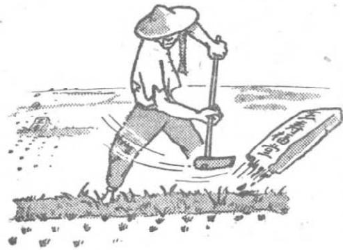
← ③ 土地重分配，耕者有其田