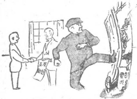
⑤ 反對帝國主義侵略， 和友好國家互助合作 ←