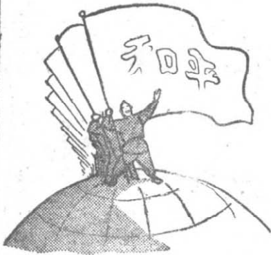
⑤ 站在國際和平民主陣營 方面保衛世界的持久和 平 ←