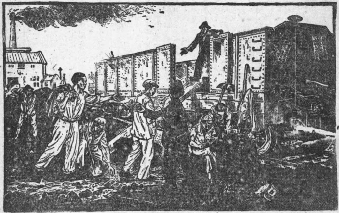
作樺李 (刻木) 習學緊加