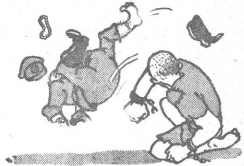
① 打垮反動政權， 人民從此翻身 →