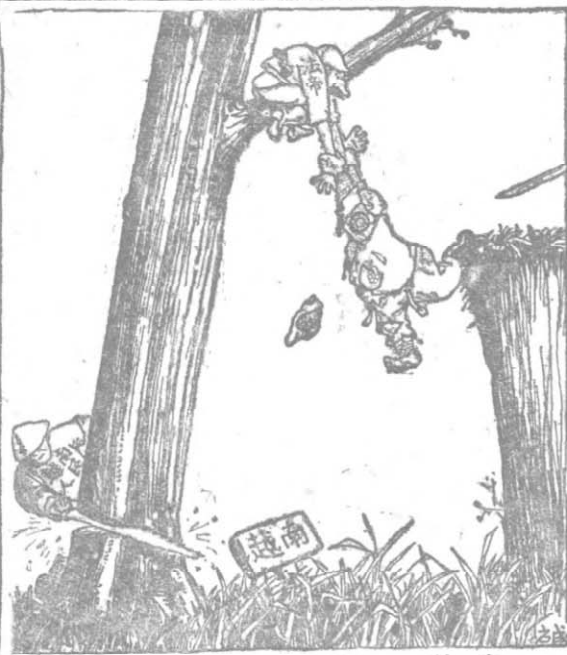
南 越 个