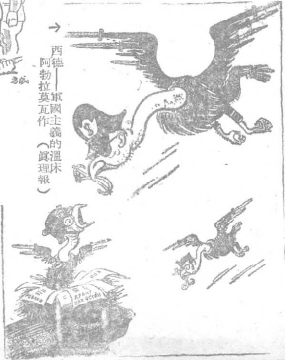
→ 西德—軍國主義的溫床 阿勃拉莫瓦作 (真理報)

「由于中國人民的勝利，歐亞人民民主國家與蘇維埃社會主義國家一起，共擁有人口將近八萬萬。並且還應記牢：在資本主義國家本國及其殖民地內，還有數萬萬勞動人民也在為和平與民主而鬥爭。」（摘自馬林科夫偉大十月社會主義革命三十二週年的報告）