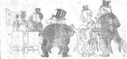
五 目 擊 畢 露