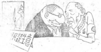
三 一 貫 政 策