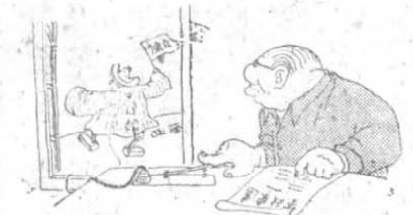
四 兩 面 做 法