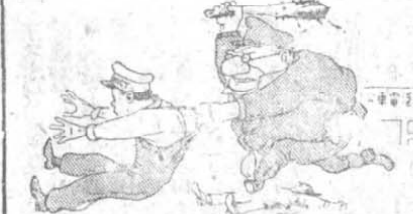
六 七 侵 略 先 鋒