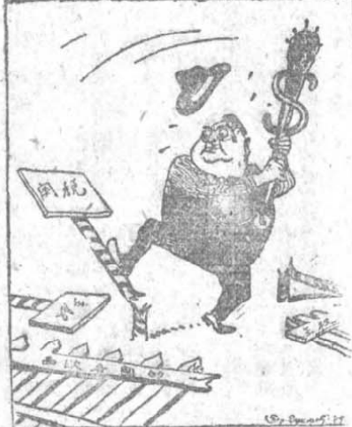
美 帝 如 何 解 決 市 場 問 題 (報 動 勞) 英 菲 畢

不 要 忘 記 老 爺 們 (作 而 念 紀 年 週 二 卅 軍 建 蘇 爲) (報 動 勞) 作 據 凱