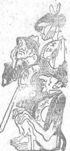
工 黨 在 英 國 的 空 虛 (報 動 勞) 作 斯 里