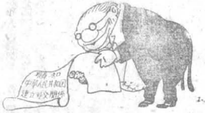
二 明 勾 暗 搭